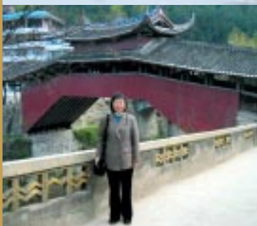
上圖：北京慕田峪長城黃昏 下圖：溫州泰順古廊橋（溪東橋）