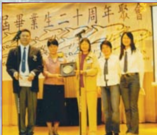
籌委致送紀念銀碟予母校，由羅副校及陳副校代表接受。