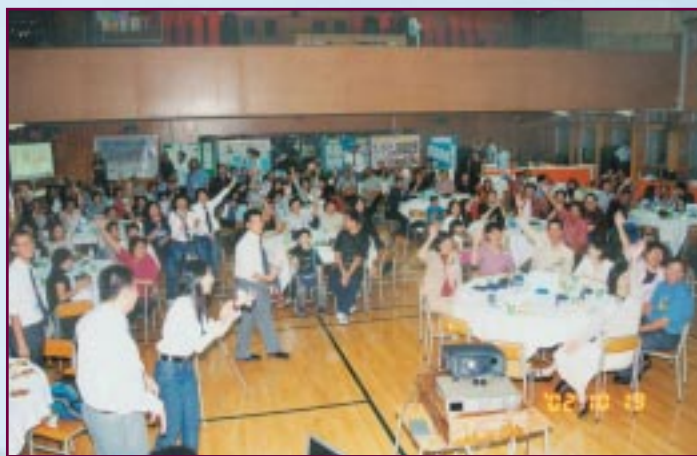
各同學及嘉賓踴躍參與，選出“廿載不變”的參賽同學。