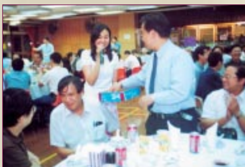
▲ 當晚筵開數十席，出席校友百多人，情況熱鬧。