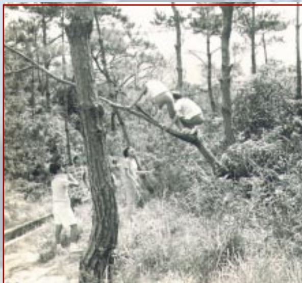
中一旅行薑花澗，你可猜到哪一位頑童今天當了入境處總主任，哪一位是新聞官？

周Sir平日工作繁忙，閒來喜歡聽聽古典音樂及閱讀，是一位很感性的理科人。他在香港大學理科特別榮譽畢業後，便投身教育工作，至今已三十餘年。期間，他教過不少類別的院校，亦擔任過很多公職（詳列於本文後）。他堪稱是一