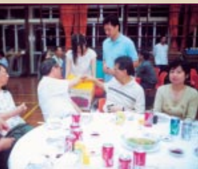
校友踴躍捐款 支持校友會

場拍賣，為校友會籌募經費。當晚拍賣及捐款所得共超過一萬多元，十分多謝校友們對校友會的支持。