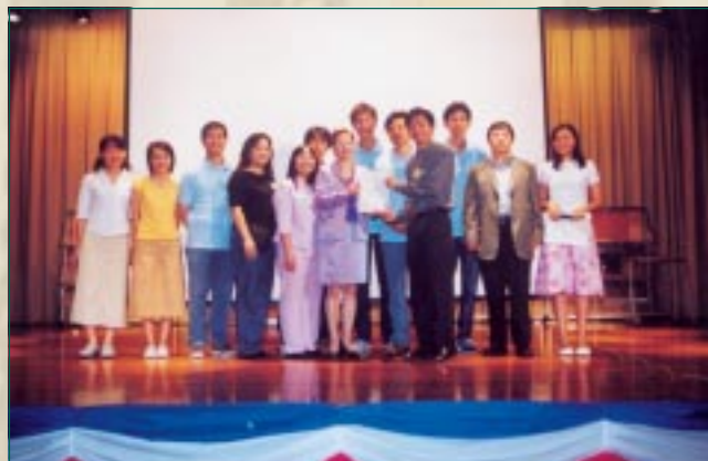
新一屆執委會成員接受上屆會長頒授委任狀

一年一度的校友會周年大會暨聚餐，在各位校友的熱烈支持下，於二零零二年七月十三日，在母校順利舉行，並進行第二屆理事會暨第四屆執行委員會職員選舉。