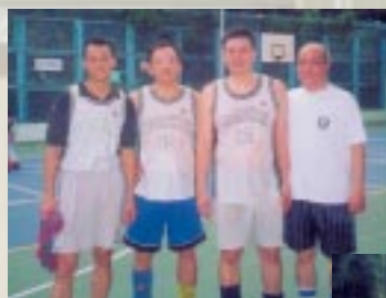
▲ 部份隊員賽後合照

十月二十三日，一個陰暗的下午，由於之前曾經灑過一兩陣雨，籃球場的情況並不理想，但雙方球員熱情不減，所以決定照原定計劃進行比賽，一場由校友、現役校隊的比賽就在濕滑的場地上開始，比賽初段，雙方都非常謹慎，不過從第二節開始，現役校隊就憑年青力壯的優勢，續漸將分數拉開，最大差距竟有二十分之多，到第三節完畢，校隊的優勢仍沒有減少，不過這時的場地開始變得乾爽，似乎真正的比賽才剛剛開始，第四節比賽中，校友隊充份展現出筭官精神，憑一股永不放棄的態度及無比的鬥志，終於完場前最後一分鐘，將比數追成七十一平手，似乎年齡的差距並沒有削弱他們爭勝的決心。不過現役校隊並沒有坐以待斃，重新組織攻勢，以一個三分球回應這班大哥哥 - UNCLE，雖然校友隊最後上籃得手，但哨子聲亦在這時響起，最終年輕的校隊仍能以七十四比七十三，一分險勝校友隊。