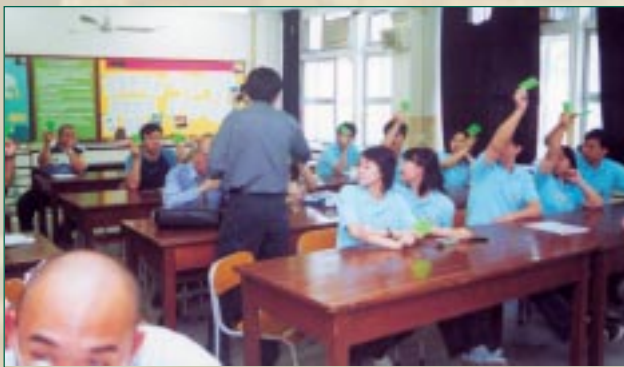
周年大會選舉投票盛況

場拍賣，為校友會籌募經費。當晚拍賣及捐款所得共超過一萬多元，十分多謝校友們對校友會的支持。