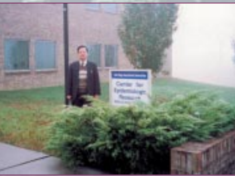
91年獲選派前往美國接受核子輻射意外處理訓練，於 Tennessee Radiation Emergency Assistance Centre Training Site 留影

在工作中最感覺驕傲的是91年被政府選派前往美國著名的Tennessee Radiation Emergency Assistance Centre Training Site，為香港首批醫生接受核子輻射意外處理訓練，以便回港訓練其他醫務人員，如何處理可能發生的大亞灣核電站的意外及各項後勤安排。