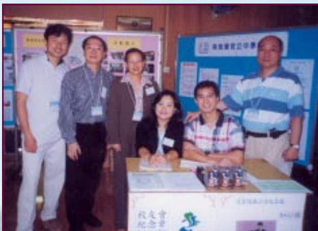
校友會幹事出席第十七屆畢業同學二十周年晚宴，並於校友會展版及售賣紀念品攤位前留影。