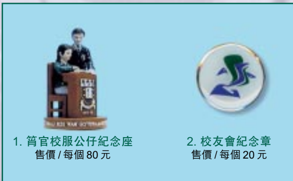
1. 筲官校服公仔紀念座 售價/每個80元