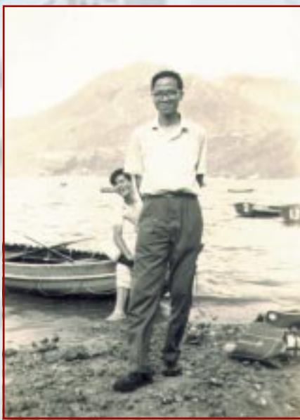
跟學生划艇也是一種活動

六、七十年代的香港社會，經濟遠不及現代，未有強迫教育制度，男女亦不平等，同樣職級的女同事，薪酬只及男的四分之三（幸而她們沒有挾著算盤上班，敬業樂業，肯為同工不同酬而賣力）。不過女孩子則比較苦命，我所教的女生中，就有幾個要中途辮學，主要是家