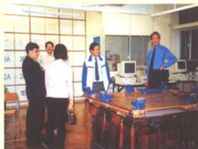
校友到處參觀校舍和新設施（圖為設計與科技室）