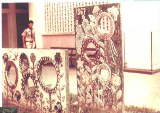
陳炳添老師與學生創作之展品

在教育事業退休後，便是他藝術生命的再生。在言談間不難感染到他對藝術創作的熱誠。他的作品，沒有