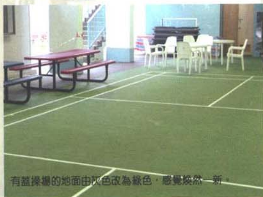
有蓋操場的地面由灰色改為綠色，感覺煥然一新。

剛過去的暑假，母校內部進行大裝修，許多地方如禮堂、入口大堂及有蓋操場等都經過修葺，其中以有蓋操場變化最大，牆上及支柱都髹上淺藍色，地面則由原來單調的灰色地板改為綠