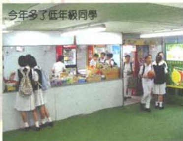
今年多了低年級同學

今年升中派位因其機制有性別歧視之嫌而接到多宗上訴，許多學生上訴得直，升讀心中理想的中學，但亦因此令許多學校超額收生，其中以官校的情況較嚴重，母校筲官亦不例外，中一級要加開一班(F.1F)以容納多收的學生，校園內亦登時熱鬧許多；但另一方面，在此情況下，現有的課室顯得不敷應用，緩急之計是中四級多一班成為浮動班，而於有蓋操場正興建一間課室，將於十月竣工，以舒緩目前的狀況，但隨著母校擴建工程的展開，相信課室不足的問題可得到完滿解決。