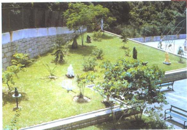
一九六八年雕塑展的部份展品

歲月滄桑，反而給人活潑開朗，熱愛生命的感覺。這些特點，也許源於他積極樂觀的性格，對未來充滿希望和憧憬。他在過去數十年在美術教育界的貢獻，是同行有目共睹的事實。唯望在未來的日子裏，他能堅持這份孜孜不倦的精神，使他的藝術生命得以在創作中延續。■