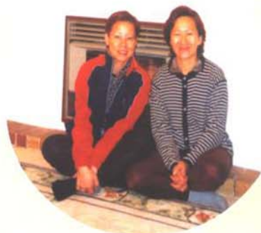
兩位同名校友，當年亦是戰友，澳洲相見歡。