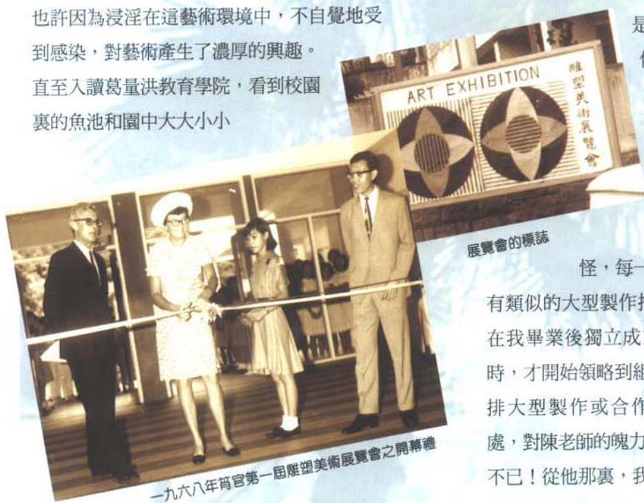
一九六八年宵官第一屆雕塑美術展覽會之開幕禮

在老師面前，我第一次製作比人還要高的雕塑，還可以擺放校園裏供眾人欣賞，那種心情是既驚且喜的。但製作大雕塑或合作製作的浮雕壁畫，已是老師最擅長的項目，他是見慣不