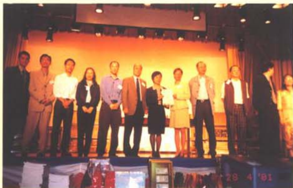
校長頒發委任狀予理事會成員

的幾百校友？校友會希望通過不同的活動，招募、推廣、廣泛團結校友，維繫友誼及共同關心母校的發展，並且提攜後進。