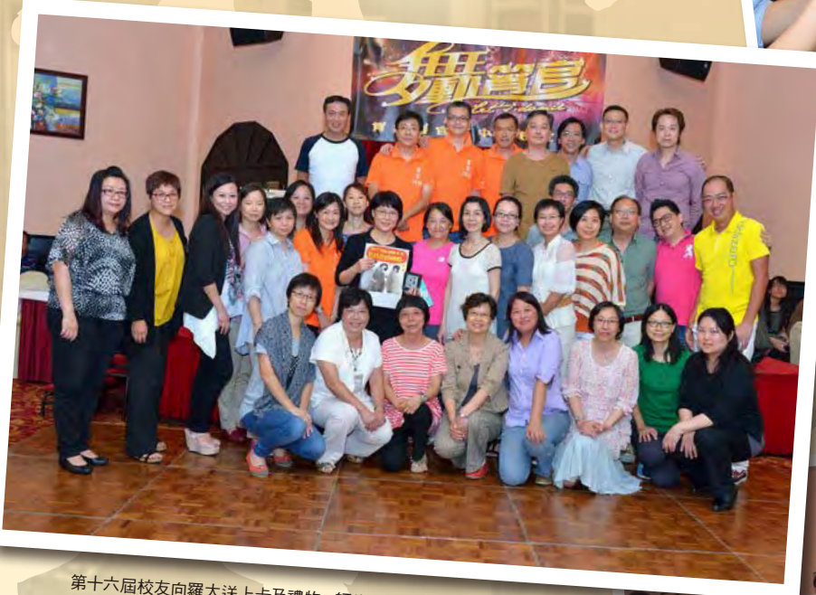
第十六屆校友向羅太送上卡及禮物, 師生們合照留念。