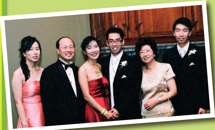
溫馨家庭照，CT笑到見牙唔見眼。

說起來簡單，但當中大有學問。CT舉了英國作為例子，英國人熱衷看足球賽事，如果有勁旅對壘或打吡戰，往往全城追看。球賽進行中，大家專心觀戰，一到半場，燒水的、上洗手間的、到廚房弄小吃的，當大家一起用電時，電力供應就會不穩甚至斷電！作為電力供應商，計算電力供求，不論是大局還是細節，都要掌握有道。