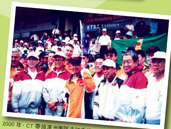
2000年，CT帶領澳洲團隊造訪香港。