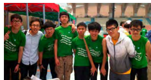
筆者(左二)與潛水機械人隊員合照