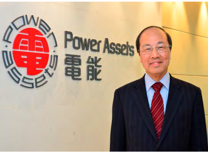
來個招牌照片先。看，黑西裝紅呔，與公司logo襯到絕呀！