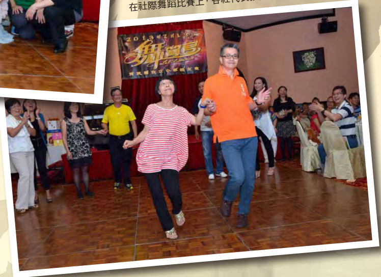
在社際舞蹈比賽上, 各社代表投入演出, 大家樂在其中。