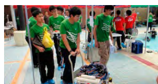
隊員們小心翼翼地將機械人運送到作賽的水池任務