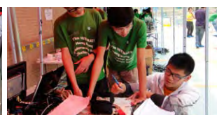
潛水機械人隊員在賽前的討論