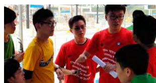
潛水機械人隊伍跟裁判討論細節