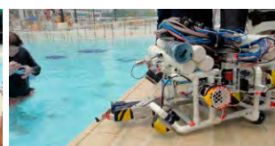
今年度筲官隊伍的機械人與水池內的計分裁判合照