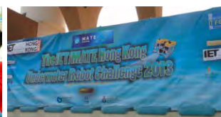
2013年香港區潛水機械人比賽在將軍澳游泳池舉行