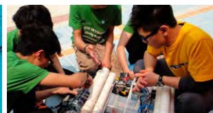
隊員在出賽前為潛水機械人作最後準備