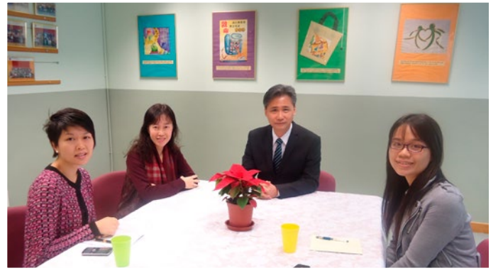
也許各位校友對新的會議室都比較陌生，這是學校新翼。 兩位舊生與校長副校長在這裡進行訪問，順便參觀。

問： 現今資訊科技瞬息萬變，對您們的教學會有什麼影響嗎？您們最希望教授學生什麼東西？