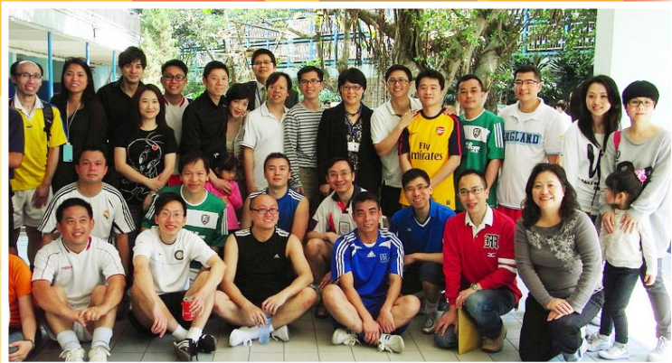
為慶祝母校金禧校慶，校友與校隊舉行了一場排球友誼比賽。