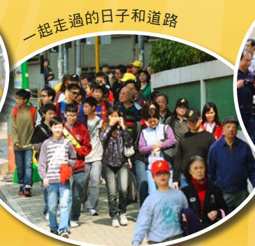
一起走過的日子和道路