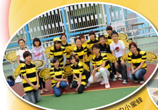
特別服裝大獎 - 活力小蜜蜂

是次環山行共有二百多人參與，共籌得超過五萬元。除必要開支外，所有款項已經轉交母校作教育之用。