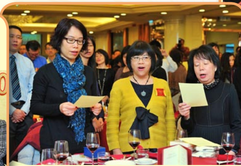
“Here again we gather together...” 由校歌為晚宴揭開序幕。