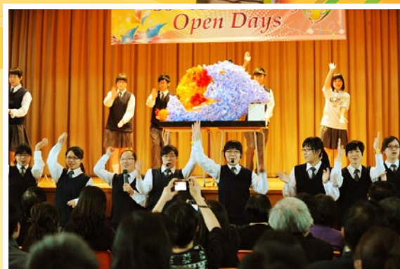
祝賀母校金禧校慶心意設計比賽，冠軍隊伍得獎作品及表演。

開放日結束後，校長及各師弟妹們列隊由禮堂至校門外以依依不捨心情由校歌和掌聲歡送各嘉賓離開。