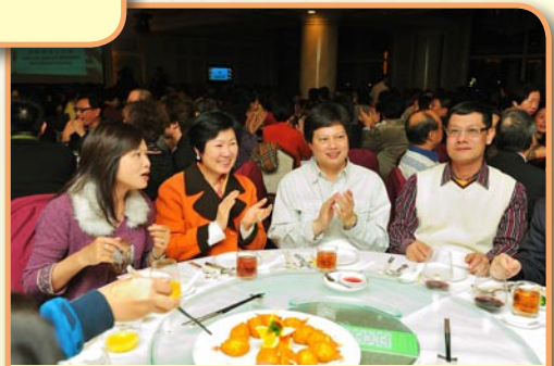
假大會堂美心酒樓舉行的筲官50週年晚宴，筵開超過50席，反應熱烈，一票難求。