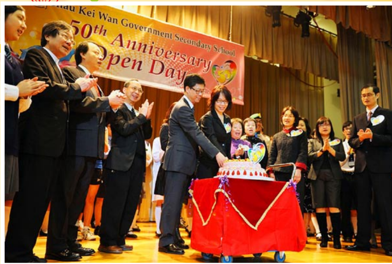
陳校長校董會主席，各校董及幾位前任社長在校歌聲中主持切餅儀式從而揭開校慶活動的序幕。