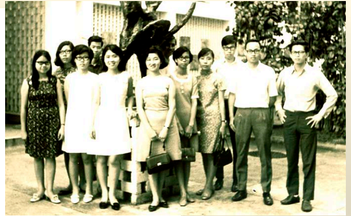
第一屆畢業生畢業兩年後回校探訪