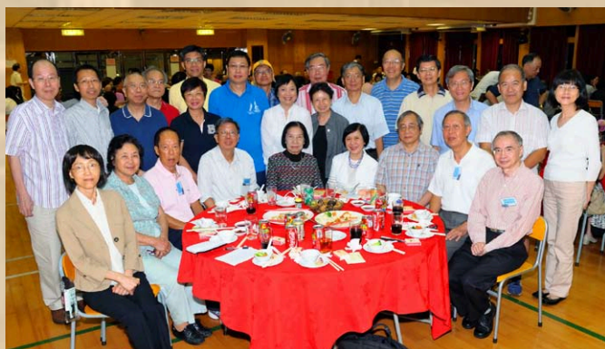
難得不同屆別的校友聚首一堂，大家來一張大合照吧！