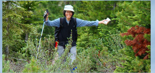
落磯山不是年青力壯者所專有，2008 年的筆者，「年過半百」、體力遠不及從前，但仗著一支行山棍，仍可享受行山的樂趣。