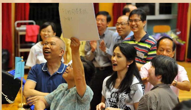
「千奇百趣@筲官」問答環節，校友們都積極參與搶問