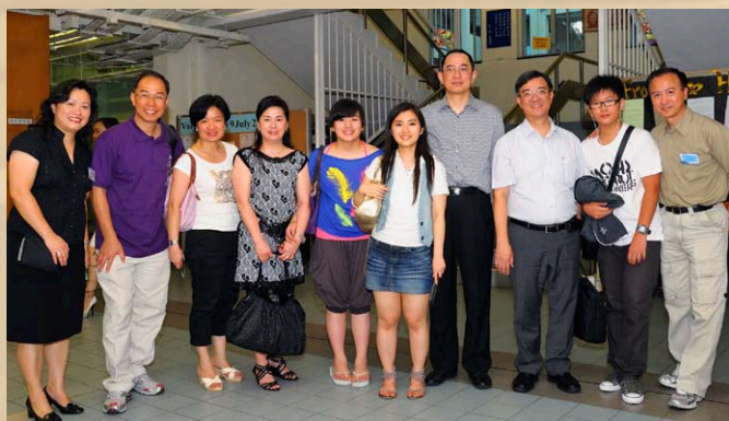
晚宴參加者人數眾多，接待人員都努熱心為參加者登記