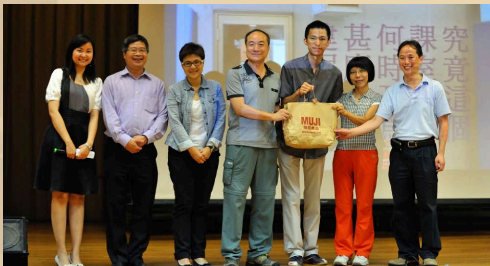
筲官奇趣事, 怎會難到我們的校友? 優勝隊伍贏得「大」禮物一份