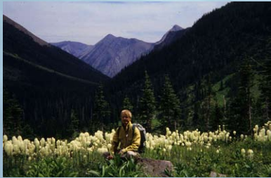
身在花叢：Beargrass 在加拿大落磯山的南端才有，大約每十年內開花三次。1996 年筆者有幸，與丈夫在美、加邊境的窩泰禮公園看見無數的 beargrass 同時盛放。