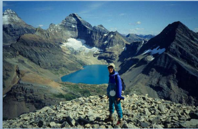
登高壯觀：1992 年，筆者與同伴攀上玉皓公園的 Little Odaray 山頂上。