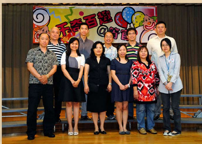
校友會的工作人員合照