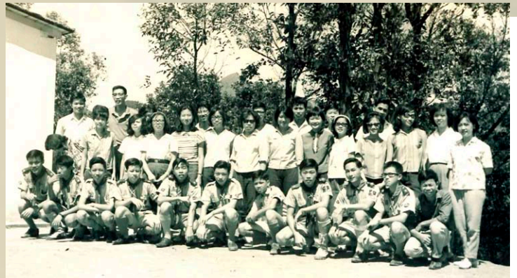
女童軍探訪男童軍