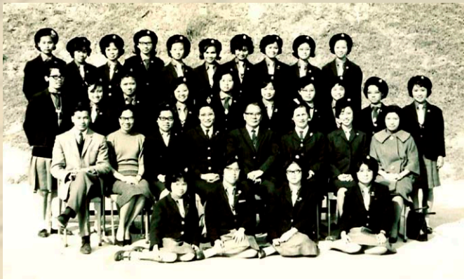
1962年筲官女童軍(香港第23旅)成立日