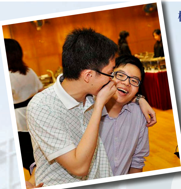
多年沒見 重聚笑逐顏開

當晚，我回到家時，已經見到 facebook 不少同學留言。大家對 2000 graduates dinner 也讚不絕口。感謝幾位主力籌劃的同學（各班代表）。除了留言，還有很多相片放在 facebook，沒有參加是次活動的同學可在 facebook 瀏覽相片，與我們一起回味當晚的歡樂。我們期待將來再聚首一堂，凝聚舊官情。