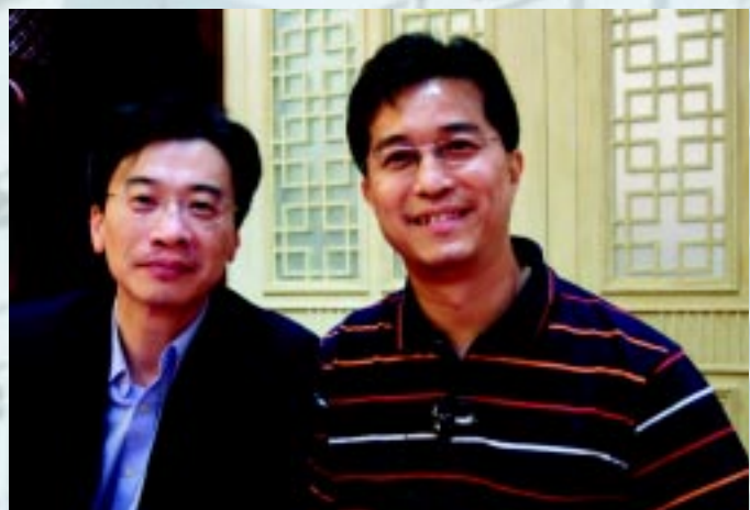
郭壽光與李國麟合照

看名人校友訪問，讀者大多希望看到該名校友的過往的驕人學校成績，現在工作上的卓越成就，或者希望從名人身上學習到成功之道，但這個訪問，你或許看不到以上的種種，但你可以看到校友幽默風趣的一面，以及他獨特的處世之道。今趟的名人校友訪問主角，是現任立法會衛生服務界議員李國麟。