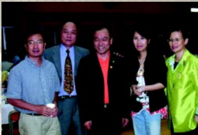
呂珊回到母校表演，與校友共聚

訪問接近尾聲，呂珊說她小時候除了喜歡唱歌拍戲外，還想當教師和警察。現在她已不想當教師了，但是依然渴望做警察，因為警察可以除暴安良，十分正氣。她笑言母親說她很適合當「突擊部隊」，因為她反應快，身手敏捷。最後，她說非常懷念在筲官的歲月，而且很掛念當年的同學，希望有機會重聚。