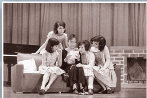
參與話劇演出的劇照 (Margaret：前左一)