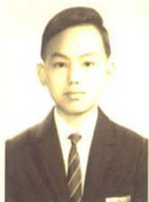
兩張不同年代的相片